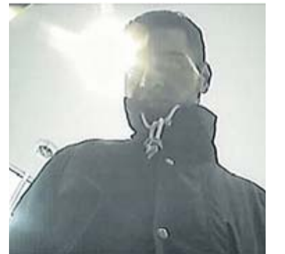
Mit dem Foto einer Überwachungskamera sucht die Polizei diesen Geldabheber.

HINWEISE nimmt die Kriminalpolizei unter der Telefonnummer 0371 3873445 entgegen.